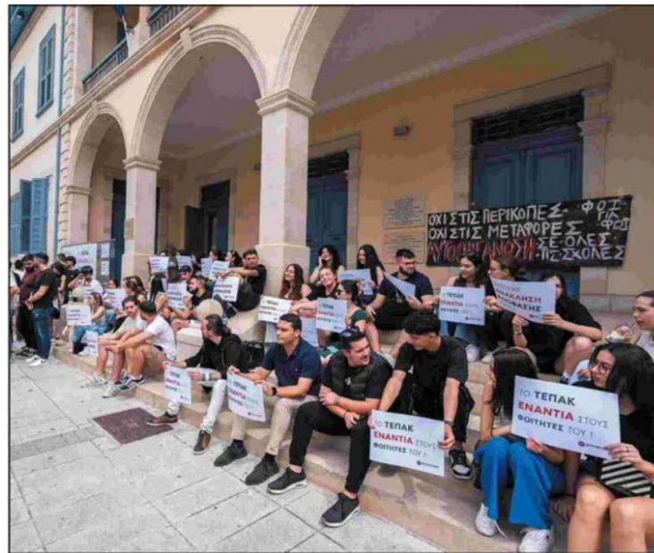
Tepak students protested outside the rector's building

Λέξη κλειδί: ΤΕΧΝΟΛΟΓΙΚΟ ΠΑΝΕΠΙΣΤΗΜΙΟ ΚΥΠΡΟΥ