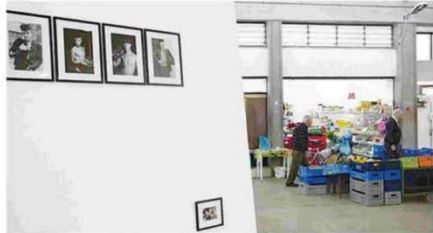
Στιγμιότυπο από την έκθεση «Διόρθωση» της Πάλλας Ρεβενιώτη που έγινε στον χώρο της Αγοράς το 2014.

«Είναι μια μικρή έκθεση που ασχολείται με την ιστορία και την εξέλιξη του κτηρίου της πρώην Δημοτικής Αγοράς Λευκωσίας. Περιλαμβάνει πλούσιο φωτογραφικό υλικό, τεχνολογικές εφαρμογές αλλά και αυθεντικά αρχιτεκτονικά σχέδια και σκίτσα τόσο από την κατασκευή του κτηρίου το 1965 όσο και από την πρόφαση συντήρησης και ανακαίνισής του. Πρόκειται για την πρώτη έκθεση που πραγματοποιείται στον