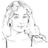
Γράφει η Χριστοθέα Ιακώβου

Το κτίριο του Σταύρου Οικονομού άνοιξε τις πύλες του μετά από αρκετό καιρό και συστήνεται στο κοινό ως Κέντρο Αριστείας CYENS, καθώς παρουσιάζει μια έκθεση από αρχιτεκτονικά σχέδια, φωτογραφίες και σταθμούς που σημάδεψαν την ιστορία της Αγοράς