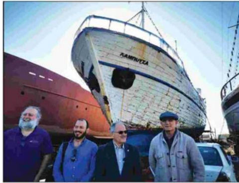
The boat in the Limassol shipyard

in the late 18th century as a sailing vessel. It dominated the Aegean in the 19th century and was later known as 'aerotrata' in the early 20th century.