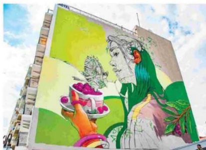
Επιλέχθηκαν σημεία στην πόλη που «ταλαιπωρούνται» εδώ και χρόνια από την ασχμία και τις ρουτιζόρες, αλλάζοντας καθοριστικά την όψη του κέντρου της Λεμεσού.

Στο χώρο του παλιού ΓΣΟ, στην οδό Ελλάδος, στο παλιό λιμάνι, στην οδό Ειρήνης, στην οδό Κονάρη, καθώς και σε άλλα σημεία, οι Λεμεσώτες και όχι μόνο, μπορούν πλέον να θαυμάσουν εντυπωσιακές τοιχογραφίες από καταξιωμένους δημιουργούς. Οι εντυπωσιακές δημιουργίες είναι σχέδια των ίδιων των καλλιτεκτών κάτω από το γενικό θέμα της οικολογίας, της πράσινης ενέργειας και της ανακύκλωσης.