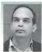
Καθηγητής Παναγιώτης Ζαφείρης Πρύτανης Τεχνολογικού Πανεπιστημίου Κύπρου

Η Πολιτεία πρέπει να δώσει τη δυνατότητα και στα δημόσια πανεπιστήμια να προσφέρουν προγράμματα σπουδών σε άλλες γλώσσες