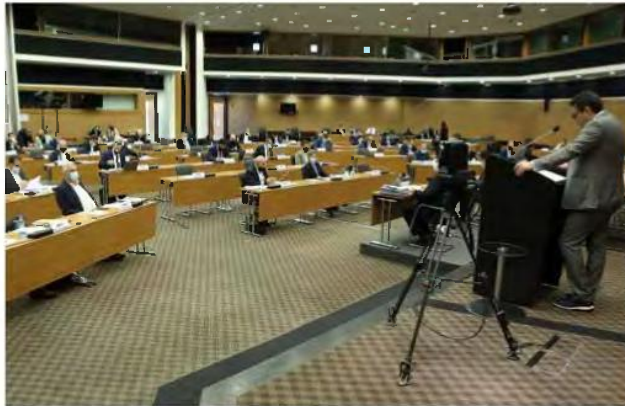
ΕΛΑΜ: ΨΑΛΙΔΙ ΣΕ ΚΟΝΔΥΛΙΑ ΓΙΑ Τ/Κ ΚΑΙ ΜΕΤΑΝΑΣΤΕΣ

Η συζήτηση του κρατικού προϋπολογισμού του 2022 θα αρχίσει την Τετάρτη με τις ομιλίες των αρχηγών των κομμάτων και θα ολοκληρωθεί την Παρασκευή 17 του μήνα με τη διαδικασία της ψηφοφορίας. Οι ομιλίες των βουλευτών είναι δεδομένο πως θα επικεντρωθούν στην ακρίβεια, στις αυξήσεις αλλά και στην παν-