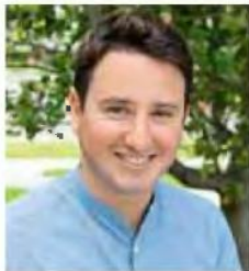
Ο 34χρονος οικονομολόγος Γκαμπριέλ Ζούκιαν είναι αναπληρωτής καθηγητής στο Πανεπιστήμιο της Καλιφόρνιας, στο Berkeley.

Συν εκτίμηση ότι φθάνει στο τέλος της η περίοδος της παγκοσμιοποίησης που χαρακτηρίστηκε από μια μόνιμη εκστρατεία απορρύθμισης και μείωσης της φορολογίας για τα πιο εύπορα στρώματα προβαίνει, σε αποκλειστική συνέντευξη του στην «Κ», ο Γκαμπριέλ Ζούκιαν, διευθυντής του νεοσύστατου Παρατηρητηρίου της Ε.Ε. για τη Φορολογία.