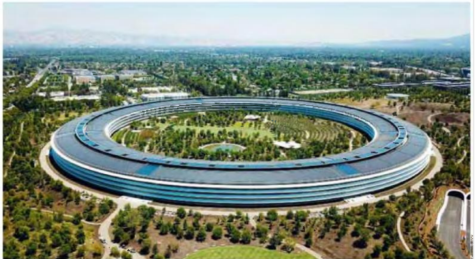
Υπολογίζεται ότι τα κράτη-μέλη της Ε.Ε. κάνουν περισσότερα από 50 δισ. ευρώ ετησίως εξαιτίας της εταιρικής φοροαποφυγής. Τα τελευταία χρόνια, τεχνολογικοί κολοσσοί έχουν βρεθεί στο στόχαστρο της Κομισιόν (φωτ. από τα κεντρικά γραφεία της Apple στο Κουπερτίνο της Καλιφόρνιας).

Το επίπεδο στο οποίο φαίνεται ότι θα επιτευχθεί συμφωνία, ωστόσο, το 15%, «κείται όντως πολύ χαμηλό», λέει, ιδίως αν συγκριθεί με τη μέση φορολόγηση των εισοδημάτων των εργατικών και της μεσαίας τάξης στη Δύση, που κυμαίνεται γύρω στο 30-40%. «Όμως οι χώρες που θέλουν να φανούν πιο φιλόδοξες, μπορούν να το κάνουν. Δεν χρειαζόμαστε γι' αυτό συμφωνία μεταξύ 138 χωρών – αυτόν που συμμετέχουν στη διαδικασία του ΟΟΣΑ. Αρκεί να έχουμε