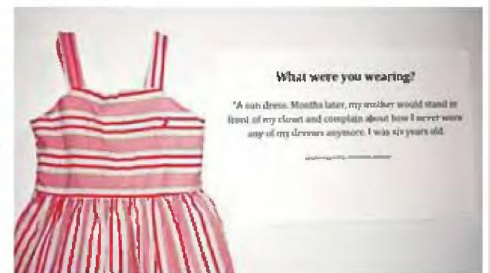
«What Were You Wearing?», University of Arkansas 2013.