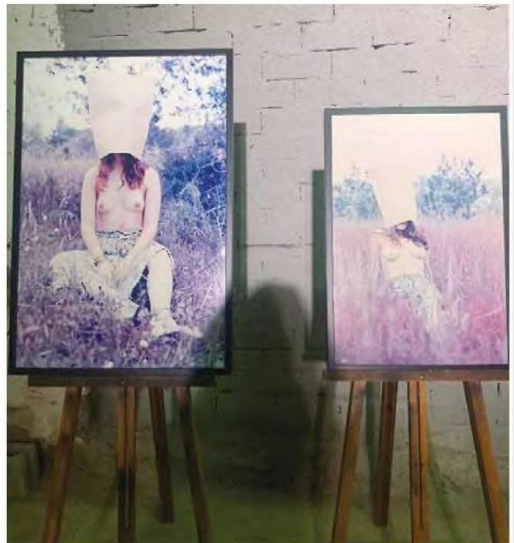
Από την έκθεση «Ρώγες» στην Κύπρο, Οκτώβρης 2019.

απλώς το γυμνό σώμα, η "μούσα", η ερωμένη, το υποκείμενο μιας εν πολλοίς πδονοβλεπτικής και εξουσιαστικής θέσης των πραγμάτων, ενώ η βία επί των γυναικών –συγκεκριμένη ή μη– υπήρξε το θέμα αρκετών μεγάλων έργων τέχνης. Στη σύγχρονη εποχή γνωρίζουμε, ωστόσο, ότι το πρόβλημα δεν είναι απλώς η έξωθεν επιβολή ενός πλαισίου καταστολής, αλλά ότι αυτές οι κυριαρχικές δομές λειτουργούν συγκροτητικά: με άλλα λόγια, οι σχέσεις εξουσίας και οι επιβαλλόμενες δομές έχουν ήδη διαμορφώσει τον δημόσιο χώρο και έχουν εσωτερικευθεί από τα υποκείμενα. Που σημαίνει ότι