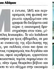
Μοναδική διεξόδος για εκατοστάδες καταστήματα το online εμπόριο και οι καίνον παραδόσεις

Με έντονα, SMS και περιορισμούς στη φυσική παρουσία εργαζομένων στο γραφείο θα διεγείσει από αύριο η οικονομική δραστηριότητα στον τόπο, μέχρι και το τέλος Ιανουαρίου. Το νέο lockdown που θα κρατήσει για τρεις εβδομάδες, σε μια προσπάθεια ανοικτής της εξάλειψης της πανδημίας, για πολλούς είναι πιο ήπιος σε σχέση με τους περιορισμούς του Απριλίου και του Μαρτίου, αφού αεροδρομία, εργοστάσια και κατασκευαστικές τεμάχια παραμένουν σε λειτουργία, πλην όμως θεωρείται βέβαιο και αναπόφευκτο το νέο πλήγμα στην οικονομία και στην καταναλωτική. Εντούτοις, είναι κατανοητό πως τα περιοριστικά μέτρα που ληρβωνονται έχουν διπλό σκοπό, αφού πέραν της αναστολή της πανδημίας στοχεύουν και στη βελτίωση της επημερολογίας εκινείας της Κύπρου ενάντια της νέας τουριστικής σεζόν.