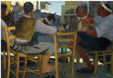
Αδαμάντιος Διαμαντής. «Αμαζήρες της Ασμαλίτη», λάδι σε καμβά, 1943 - Συλλογή Κρατικής Πινακοθήκης