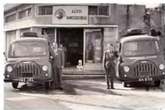
Αρχείο Λαϊκού Καφεκοπτείου