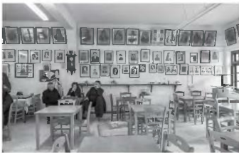
Νικόλας Κωνσταντίνου, «Καφέ της παρηγοριάς», Άρρος, 2019