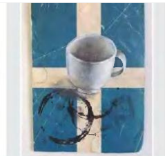
Ανδρέας Νικολάου, «Τύχη II», ακρυλικό σε χαρτί, 2012 - Συλλογή του καλλιτέχνη

Βέβαια οι γυναίκες απολάμβαναν τον καφέ τους στα σπίτια