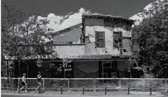
Kadiri Kaba, «Once sritifire coffee house», Λευκωσία 2007