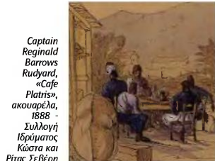
Captain Reginald Barrows Rugard, «Cafe Platras», ακουαρέλα, 1888 - Συλλογή Ιδρύματος Κώστα και Ρίτας Σεβέρη