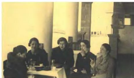
Λευκωσία, 1950, Συλλογή CVAR