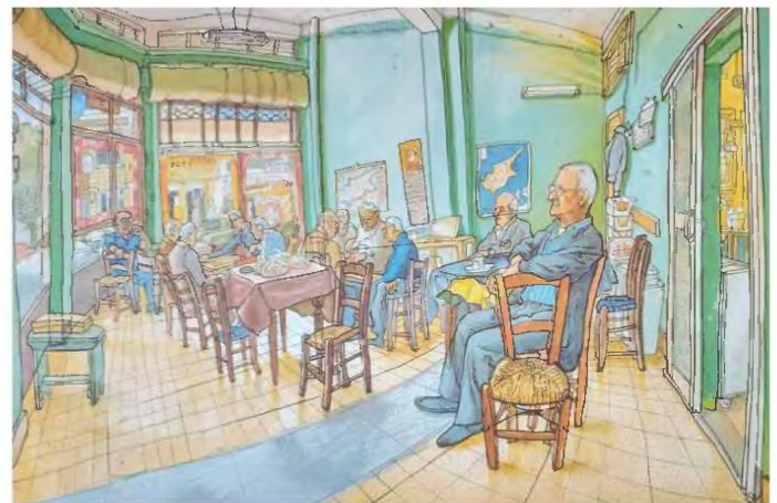
Σπύρος Δημητριάδης, «Καφενείο Ταλιάνος», λάδι σε καμβά, 2007. Ιδιωτική συλλογή