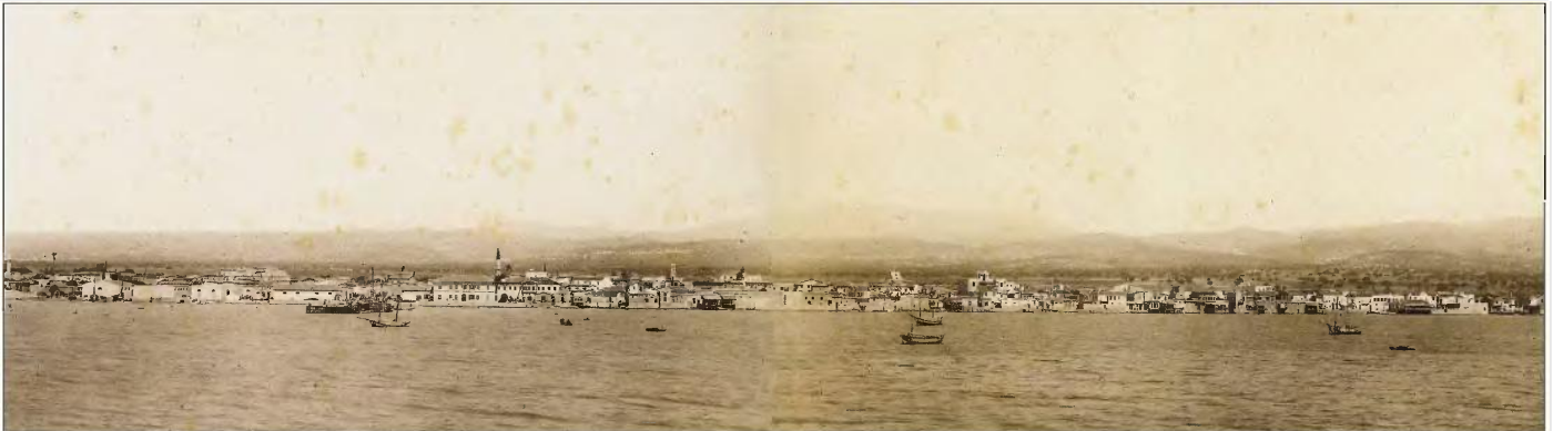
Μία πανοραμική φωτογραφία της Λεμεσού, από το γνωστό φωτογράφο Φώσκολο. Ο ερευνητής Εξηγιό πώς τη χρονολόγησε γύρω στο 1885. Πηγή φωτογραφίας: Αρχείο Χριστάκης Σεργίδης.