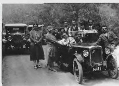
Φωτογραφία της δεκαετίας του '20, από τον φωτογράφο Γεώργιο Κυριακίδη (για πρώτη φορά στη δημοσιότητα). Πηγή: Αρχείο Χριστάκης Σεργίδης.

φυγε" από την προπολεμική τάση, κάθε πόλεμος επιφέρει και αλλαγές". Ένα άλλο παράδειγμα χρήσιμης για τον ερευνητή παρατήρησης είναι τα μοντέλα και οι πινακίδες εγγραφής των μηχανοκίνητων οχημάτων. Μπορούν επίσης να ληφθούν υπόψη και άλλα δεδομένα, όπως διαφημιστικές πινακίδες, δέντρα, ιδίως σε σύγκριση με άλλες φωτογραφίες, ή και να συνδυαστεί η φωτογραφία με γεγονότα ή πρόσωπα που παρουσιάζονται σε άλλες φωτογραφίες.