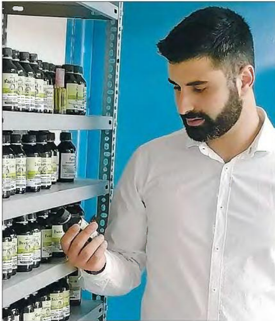
Στα δεκάδες χιλιάδες βότανα που μας περιτριγυρίζουν ένας ελάχιστος αριθμός από αυτά είναι απαγορευτικός για χρήση από τον άνθρωπο. Όλα τα βότανα που χρησιμοποιούμε, τα έχει ήδη χρησιμοποιήσει το ανθρώπινο γένος για εκατοντάδες ή χιλιάδες χρόνια με ελάχιστες ή μηδαμινές παρενέργειες.

Σε ποιες μορφές βρίσκουμε στην αγορά τα βοτανόχυτα προϊόντα και ποιες μορφές είναι οι πιο ωφέλιμες για χρήση;