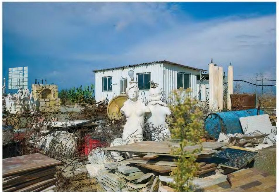
Φωτογραφία από τη σειρά «Arte-facts» που θα παρουσιάζεται από τις 13 μέχρι τις 27 Μαρτίου στο Φυτώριο Εικαστικής Καλλιέργειας (Νεχρού 2, Δημοτικός Κήπος Λευκωσίας). Εγκαίνια στις 13/03 από τις 19:30 μέχρι τις 22:00.

«Πολλά σπίτια στην Κύπρο διαθέτουν σύγχρονα αντίγραφα αρχαίων ελληνικών και ρωμαϊκών αγαλμάτων. Ενώ τα 'αυθεντικά' αγάλματα εκτίθενται ως μουσειακά αντικείμενα σε βάθρα ή πίσω από γυάλινες θήκες τόσο στην Κύπρο όσο και στο εξωτερικό, πραγματικού μεγέθους αντίγραφα κατεβαίνουν από τα βάθρα τους και ζουν μια καθημερινή ζωή», αναφέρεται σε σχετική ανακοίνωση για την έκθεση της φωτογράφου. «Γίνονται οικιακά αντικείμενα, συχνά εκτεθειμένα σε διάφορες καιρικές συνθήκες, τοποθετημένα δίπλα από φυτά και άλλα αντικείμενα καθημερινής ζωής».