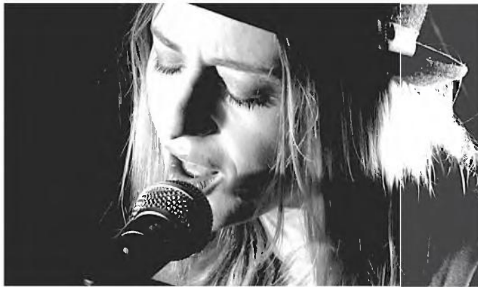
Η Γαλλίδα τραγουδίστρια Κιράν εμφανίζεται σε Λεμεσό και Λευκωσία με ποιητικά κείμενα και μινιμαλιστικές διασκευές με πινελιές συγκίνησης.

Με πρωτοβουλία του Υπουργείου Πολιτισμού, το 2020 έχει ανακηρυχθεί «έτος κόμικς». Με βάση την ευκαιρία αυτή την ευκαιρία το Γαλλικό Ινστιτούτο κάλεσε δύο σκιτσογράφους, τον Ορελιάν Φερναντέζ και τον Γκι Ντελίλ. Η έκθεση σχεδίων κόμικς του Γκι Ντελίλ με τίτλο «Un candide au pays de l'autofiction» ανοίγει σήμερα Τρίτη στο Γαλλικό Ινστιτούτο Κύπρου και θα διαρκέσει μέχρι τις 30 Απριλίου. Εργαστήρια με μαθητές θα γίνουν στις 16 και 17 Μαρτίου, ενώ τον Απρίλη θα γίνει συνάντηση με 15 δεκαπέντε μέλη της Ένωσης Γραφιστών και Εικονογράφων και περιπατητικό εργαστήριο στην