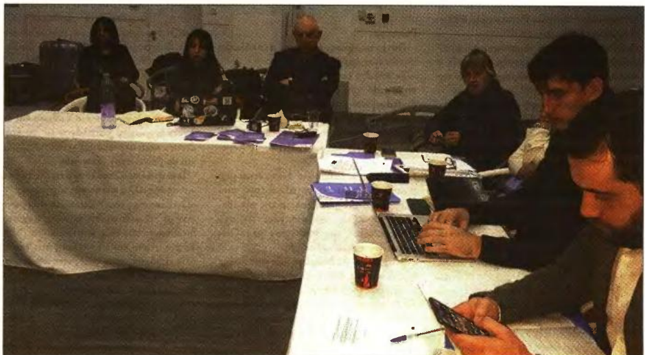
Στιγμιότυπο από την εκδήλωση της περασμένης Τρίτης.