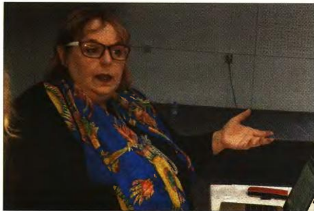
Η Δρ Suellette Dreyfus στη συζήτηση στη Δημοσιογραφική Εστία.