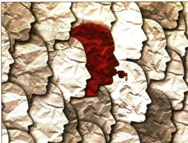
Είναι κοινή διαπίστωση ότι στην Κύπρο δεν υπάρχουν οι δικλίδες πραγματικής προστασίας του πληροφοριοδότη.

λονται στην έλλειψη προστασίας των μαρτύρων δημοσίου συμφέροντος, μόνο για τις δημόσιες συμβάσεις, κυμαίνονται από 5,8 ως 9,6 δισεκατομμύρια ευρώ ετησίως για την Ευρωπαϊκή Ένωση συνολικά.